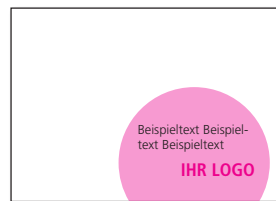
Thematischer Störer, Programmheft Langer Tag der StadtNatur (€ 590,-)