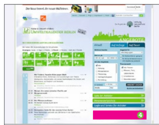
Content Ad Trefferlisten, 400 x 60 Pixel, Rotierendes Banner für 12 Monate (€ 3.300,-)