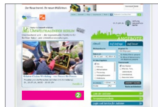
Content Ad Startseite, 476 x 64 Pixel, Rotierendes Banner für 3 Monate* (€ 1200,-)